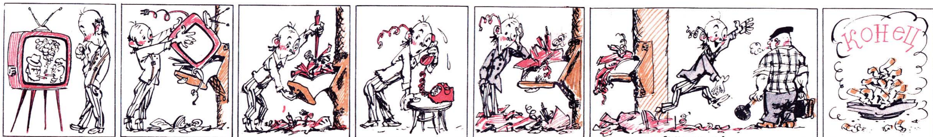
— Слесаря вызывали? — Да! Слушай, дууг, дай закурить!