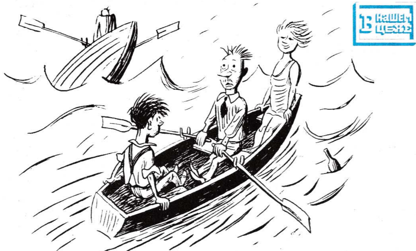
— Всего-то бутылку распили, а как качает!