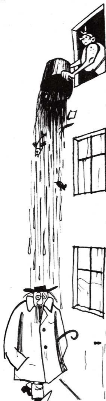
— А передавали, осадков не будет!

В. КАНАЕВ, специальный корреспондент Крокодила