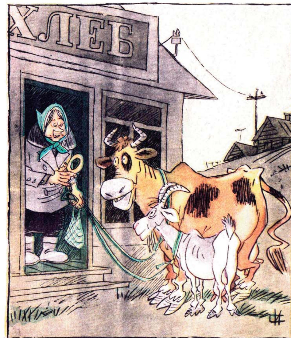
— Батонов нет, есть бублики. Брат?