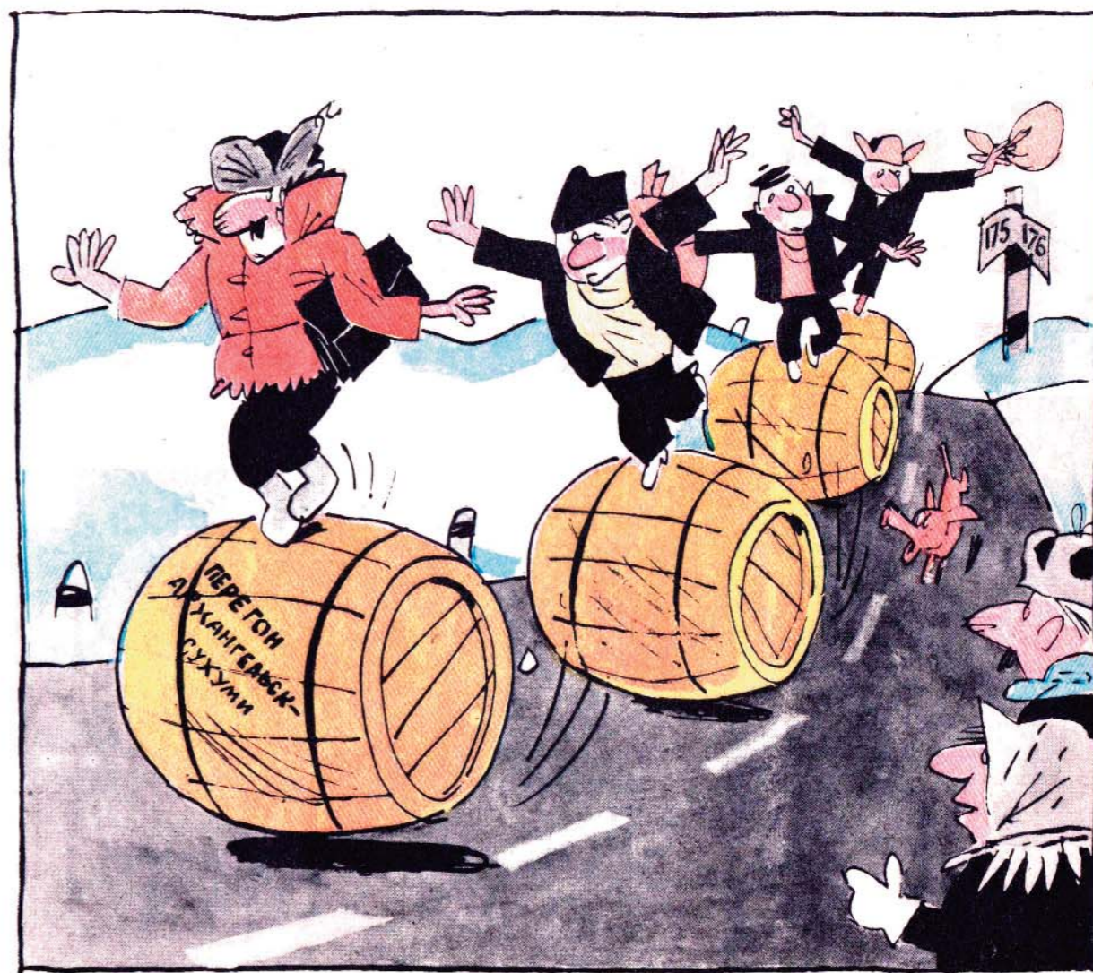
— Видно, опять под тару зшелон не дали...