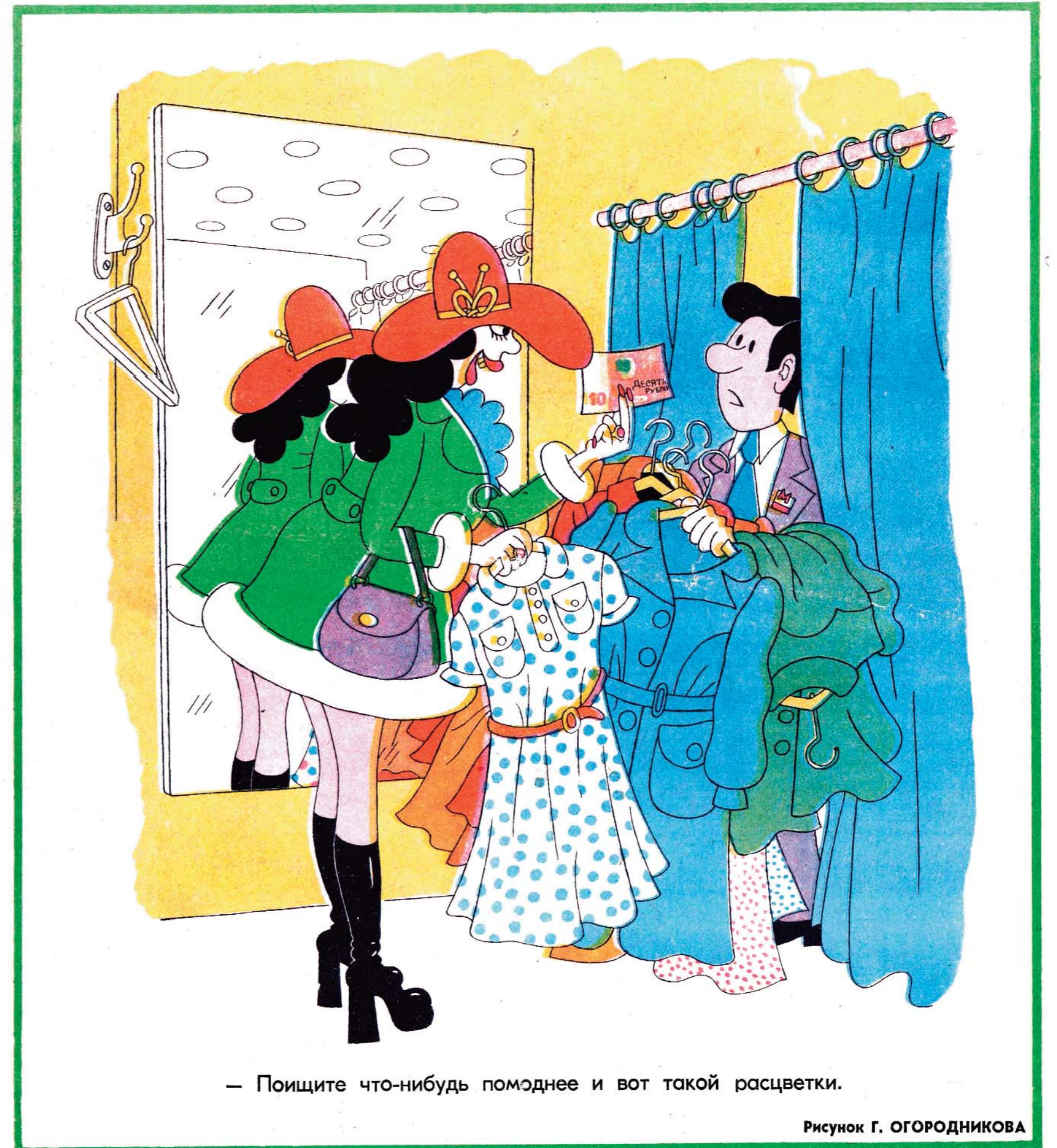
— Поищите что-нибудь помоднее и вот такой расцветки.